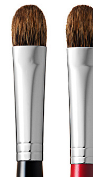
R-S6 CHIKUHODO EYE SHADOW BRUSH Кисть для макияжа глаз