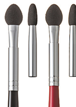
R-S5 CHIKUHODO EYE SHADOW BRUSH Кисть для макияжа глаз