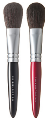
R-C4 CHIKUHODO CHEEK BRUSH Кисть для нанесения румян