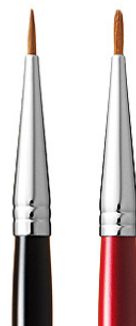
R-SL3 CHIKUHODO EYE LINER BRUSH Кисть для нанесения подводки