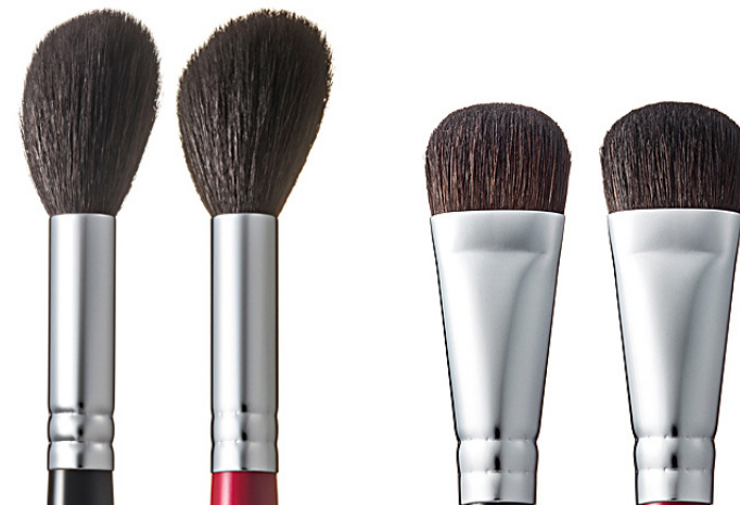
R-H1 CHIKUHODO HILIGHT BRUSH