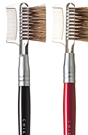
R-B2 CHIKUHODO BRUSH & COMB Кисть для бровей + гребень