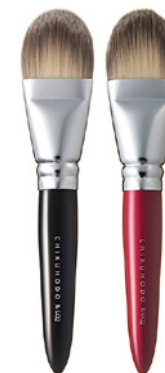
R-LQ3 CHIKUHODO LIQUID BRUSH Кисть для нанесения тонального крема