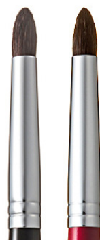
R-S4 CHIKUHODO EYE SHADOW BRUSH Кисть для макияжа глаз