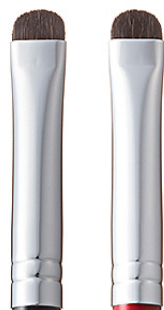
R-SL4 CHIKUHODO SHADOW LINER BRUSH Кисть для макияжа глаз со скошенным краем