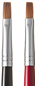
R-L1 CHIKUHODO LIP BRUSH