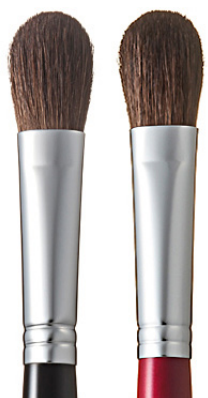
R-S1 CHIKUHODO EYE SHADOW BRUSH Кисть для макияжа глаз