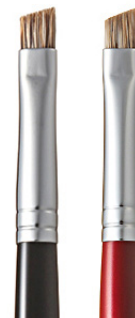
R-B1 CHIKUHODO EYEBROW BRUSH Кисть для бровей