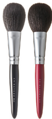
R-C3 CHIKUHODO CHEEK BRUSH Кисть для нанесения румян