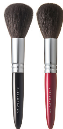
R-P3 CHIKUHODO FACE BRUSH POWDER Кисть для нанесения пудры