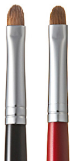
R-SL1 CHIKUHODO SHADOW LINER BRUSH Кисть для макияжа глаз со скошенным краем