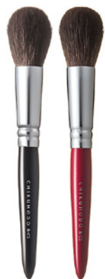
R-C2 CHIKUHODO CHEEK BRUSH Кисть для нанесения румян