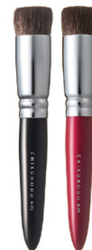
R-P5 CHIKUHODO FACE BRUSH POWDER Кисть для нанесения пудры