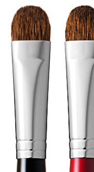
R-S7 CHIKUHODO EYE SHADOW BRUSH Кисть для макияжа глаз