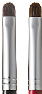
R-C01 CHIKUHODO CONCEALER BRUSH