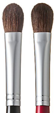
R-S2 CHIKUHODO EYE SHADOW BRUSH Кисть для макияжа глаз