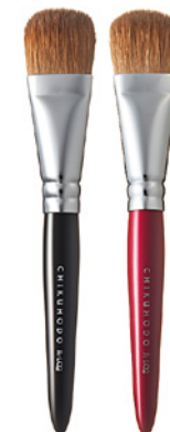
R-LQ2 CHIKUHODO LIQUID BRUSH Кисть для нанесения тонального крема