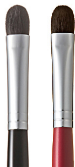
R-S3 CHIKUHODO EYE SHADOW BRUSH Кисть для макияжа глаз