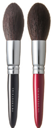
R-C1 CHIKUHODO CHEEK BRUSH Кисть для нанесения румян