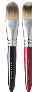
R-LQ4 CHIKUHODO LIQUID BRUSH Кисть для нанесения тонального крема