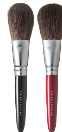
R-P7 CHIKUHODO FACE BRUSH POWDER Кисть для нанесения пудры