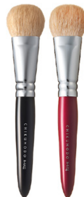
R-LQ1 CHIKUHODO LIQUID BRUSH Кисть для нанесения тонального крема