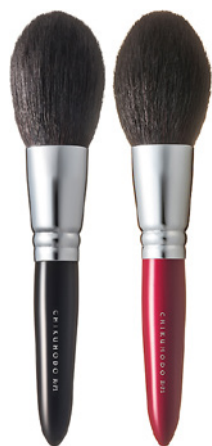
R-P1 CHIKUHODO FACE BRUSH POWDER Кисть для нанесения пудры