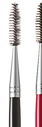
R-B3 CHIKUHODO FACE BRUSH SCREW Щеточка для бровей