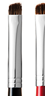
R-B4 CHIKUHODO FACE BRUSH EYEBROW Кисть для бровей со скошенным краем