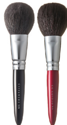
R-P4 CHIKUHODO FACE BRUSH POWDER Кисть для нанесения пудры