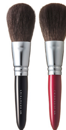
R-P6 CHIKUHODO FACE BRUSH POWDER Кисть для нанесения пудры