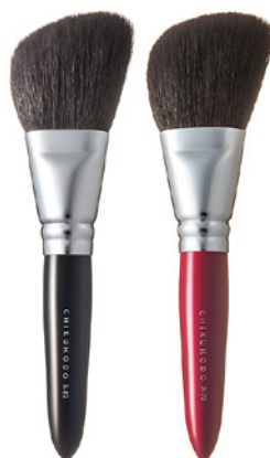
R-P2 CHIKUHODO FACE BRUSH POWDER Кисть для нанесения пудры