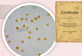
фитопланктон (одноклеточные микроводоросли каротиноиды)

Усиливает экспрессию «UCP1» в белых адипоцитах и поддерживает образование активных бежевых адипоцитов.