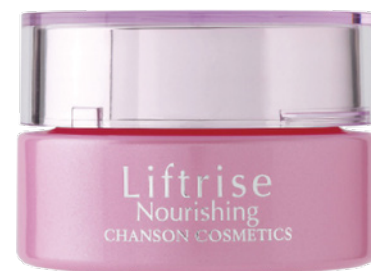
Лифтинговый Крем LIFTRISE