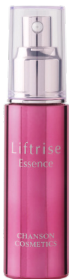
Лифтинговая Эссенция LIFTRISE