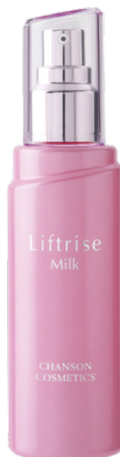
Лифтинговая Эмульсия LIFTRISE