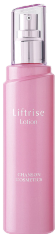
Лифтинговый Лосьон LIFTRISE